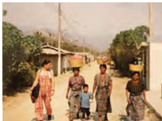
Acompañamiento a la Asociación para el Desarrollo Integral de las Víctimas de la Violencia en las Verapaces, Maya Achi (ADIVIMA), Rabinal, Baja Verapaz, 1997.

Según capacidades y experiencia de las diferentes personas que lo conforman, apoyamos en las siguientes áreas: finanzas y recaudación de fondos; manejo del personal de oficina; publicaciones; formación del voluntariado; análisis de coyuntura; seguridad. El trabajo de apoyo al equipo en terreno es constante,