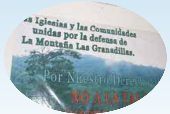
Cuidan y protegen los bienes naturales