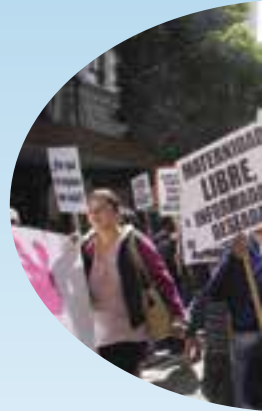
Se pronuncian violencias