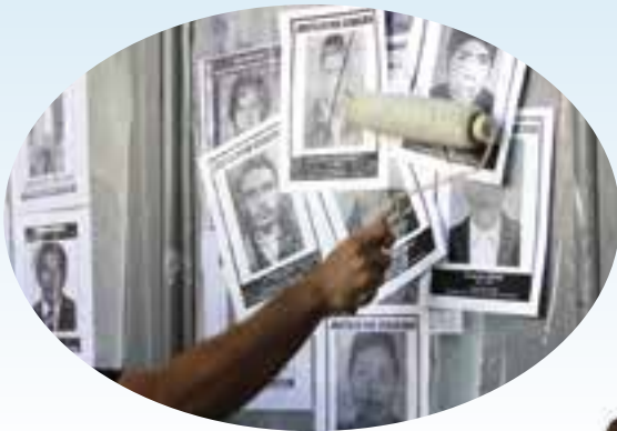
Luchan y trabajan por la justicia