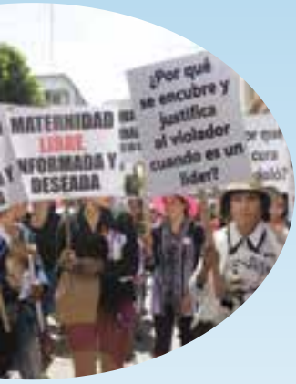
por una vida sin para las mujeres