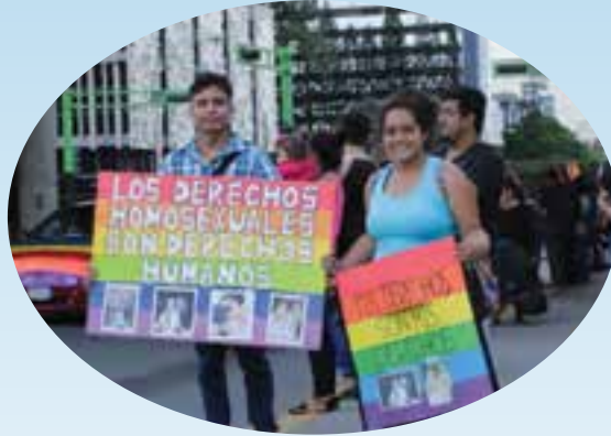
Defienden derechos LGBTI