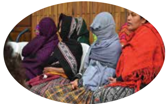
Denuncian hechos de violencia para que no vuelvan a suceder.