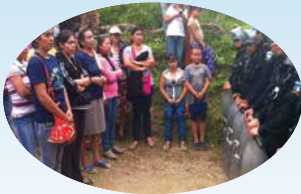
Defienden los derechos colectivos a la tierra y el territorio